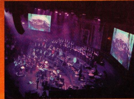
Rick Wakeman - Viagem ao Centro da Terra no Royal Albert Hall, Londres

Um ator fazia a narração da história, num espetáculo que ficou famoso pela música e pela ousadia da proposta. Em 2007, a companhia francesa Théâtre du Soleil criou um