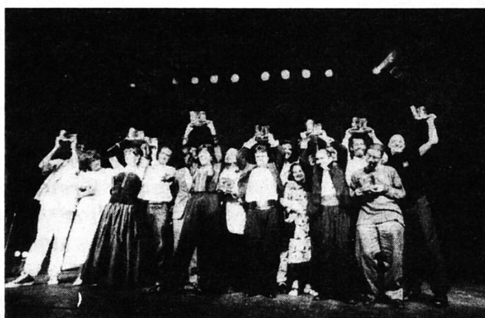
Vencedores do Prêmio Coca-Cola de Teatro Jovem/94.

Uma grande festa da família teatral. Assim pode ser definida a cerimônia de entrega da sétima edição do Prêmio Coca-Cola de Teatro Jovem, no Teatro do Hotel Nacional, reunindo centenas de pessoas da classe artística e gente ligada ao teatro. Todos, porém, perfeitamente integrados no alto astral que marcou o projeto durante o ano de 1994.