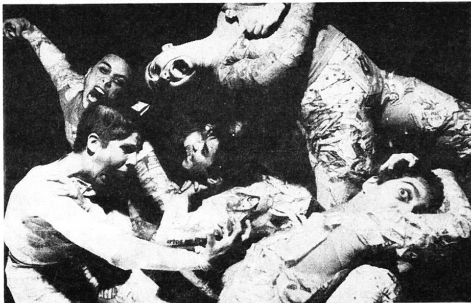
Companhia de Teatro Atores de Laura