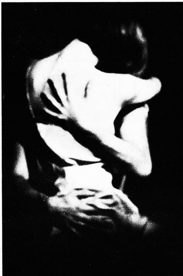
Obra: Beatrice Sasso

São 21 fotos de tamanho 50 x 70, divididas em dois atos, formando um trajeto, que são as cenas, levando o espectador a acompanhar o roteiro dramático — a história.