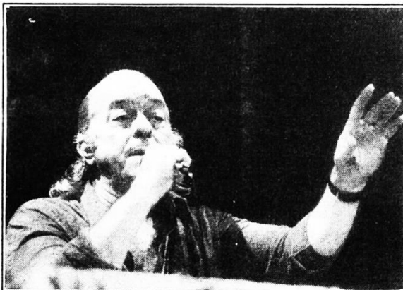
Vinicius de Moraes

Ele se definia como o "capitão do mato, poeta e diplomata, o branco mais preto do Brasil na linha direta de Xangô". Dos amigos ganhou o apelido de "poetinha". Virou nome de rua no bairro mais nobre do Rio de Janeiro - Vinicius de Moraes. E para homenagear os 80 anos de seu nascimento (19.10.1913), o teatro da Casa de Cultura Laura Alvim abrirá suas portas, a partir do próximo dia 5, para apresentar o musical "Ai quem me dera uma estação de amor". Segundo Lúcia Coelho, diretora e roteirista, "a trajetória do poeta será mostrada em um ato e quatro tempos e vivida em primaveras, verões, outonos e invernos. Dos poemas e músicas que se eternizaram na alma do povo brasileiro, das crônicas e histórias inéditas, escolhemos as que nos inspiraram a "viver". Mergulhamos na obra de VINÍCIUS misturando os sentimentos dele aos nossos e o resultado foi: AI, QUEM ME DERA UMA ESTAÇÃO DE AMOR. Na estação de amor nasceu a idéia do espetáculo em comunhão com o visual, a música, a luz, o movimento. E embarcamos numa viagem mágica e cíclica rumo à herança poética, lírica e sentimental deixada por VINÍCIUS DE MORAES. Neste espetáculo, Lúcia conta com "um presente", que é como considera a colaboração de um dos mais importantes parceiros de Vinicius-