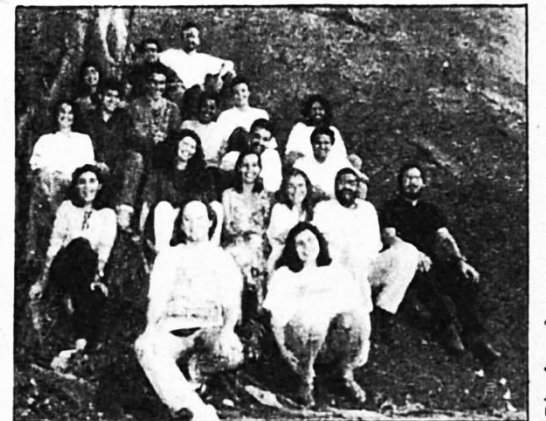
Voz & Cia.