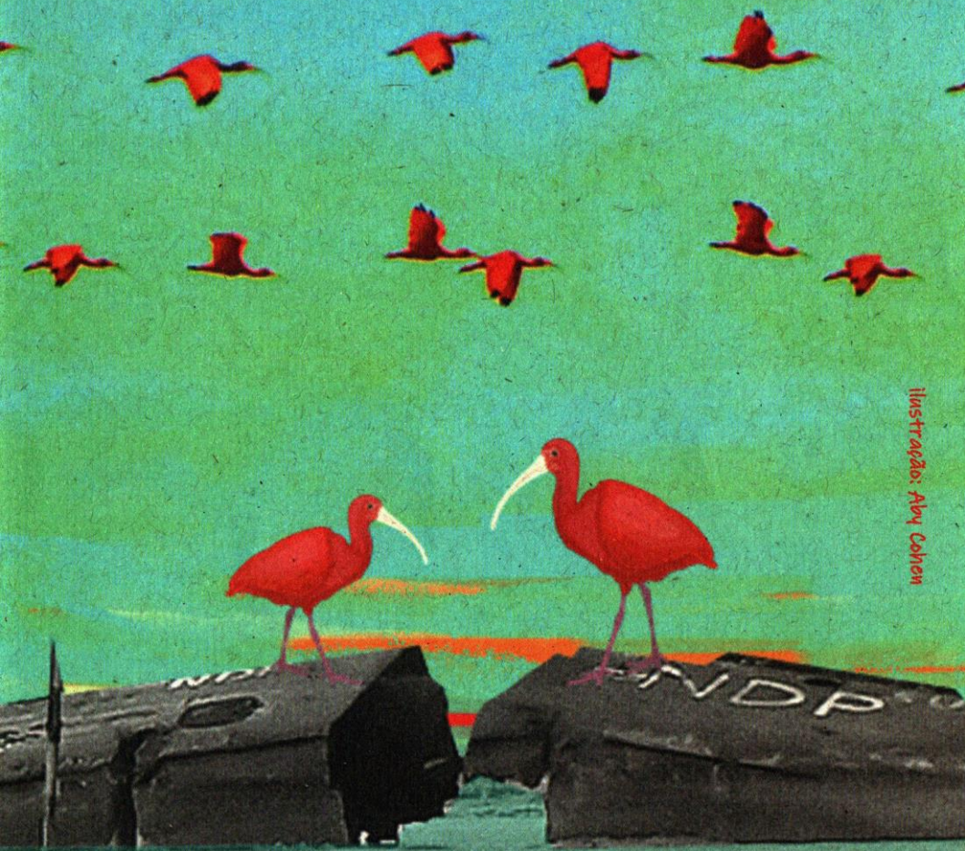
Ilustração: Abby Cohen